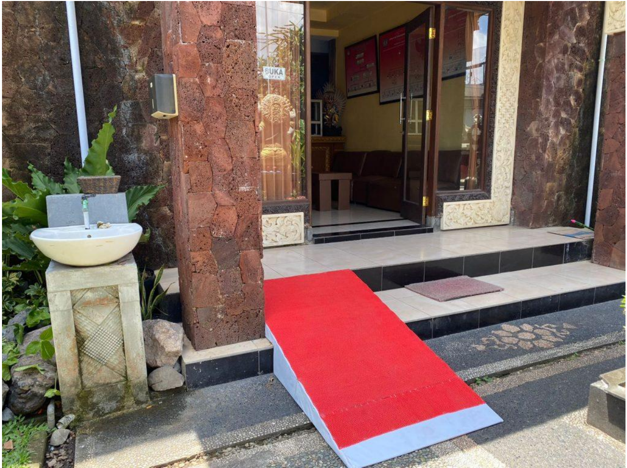
Jalur/Akses Disabilitas Dalam Pelayanan Publik Desa Dajan Peken