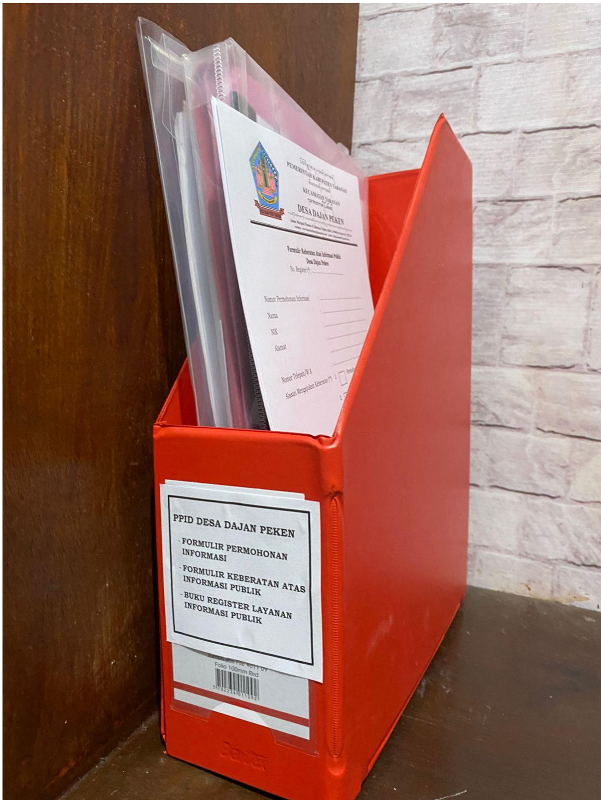
Kelengkapan Pelayanan Formulir Permohonan Informasi, Formulir Keberatan atas Informasi Publik dan Buku Register Layanan Informasi Publik yang disiapkan di meja pelayanan informasi publik Pemerintah Desa Dajan Peken