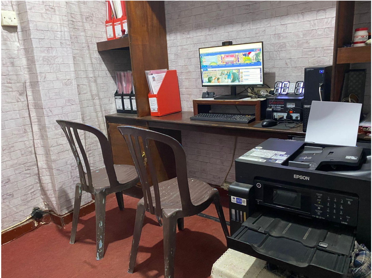
Seperangkat PC pelayanan dilengkapi Meja kursi pelayanan public PPID Desa Dajan Peken