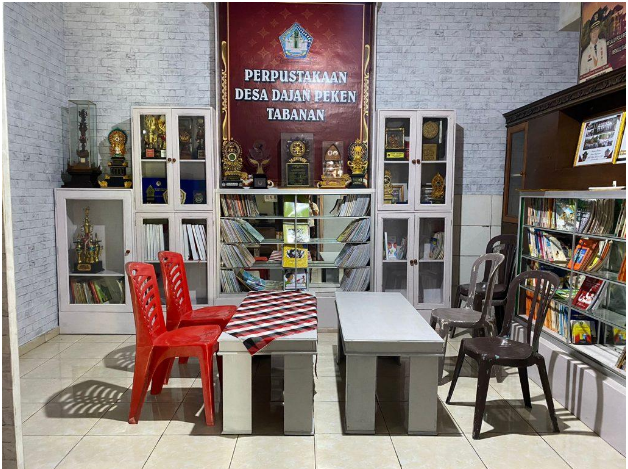
Ruang Tunggu dan Pojok Membaca Desa Dajan Peken