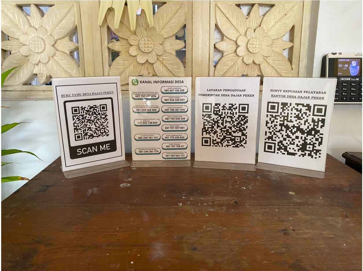
Kanal Informasi Desa, Buku Tamu, Pengaduann dan Survy Pelayanan